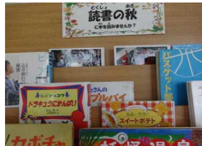
図書室のコーナー

さて、10月27日から11月9日までは「読書週間」です。今年のスローガンは「ホッと一息 本と一息」だそうです。本は心の栄養ともいわれています。本を読むことは心を育て、考える力を身につけ、感性を磨き、想像力を豊かにしてくれます。さらに、人の生き方も豊かにしてくれます。忙しい毎日の中ですが、わずかな時間でも本と向き合う時間をつくり、心に余裕を持てるようにしたいものです。